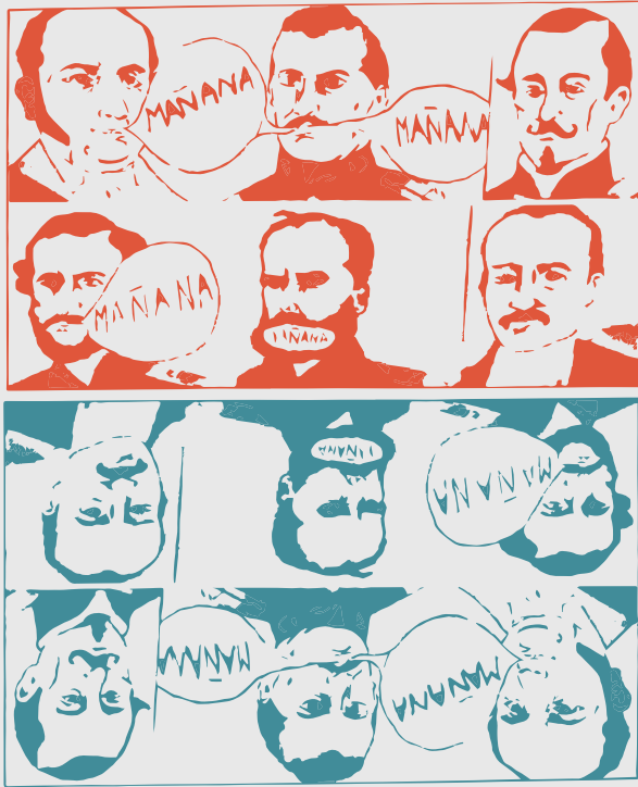
IMAGEN E HISTORIA SOCIAL EN EL PERÚ DEL SIGLO XX: